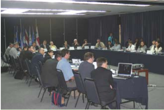
Tercera reunión de Directores de Política y Secretarios Técnicos