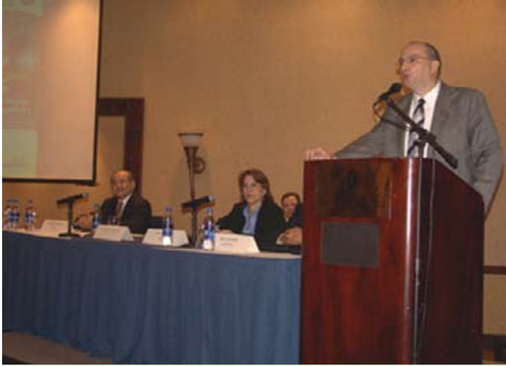
Lic. Bernardo López, Ministro de Agricultura, Ganadería y Alimentación de Guatemala inaugura el Seminario Regional sobre Políticas Públicas y Servicios Financieros Rurales.