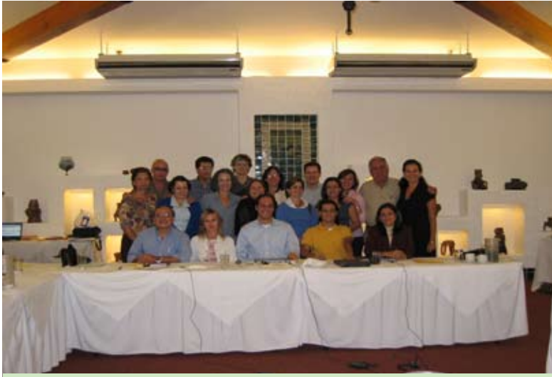
El equipo de RUTA durante el Taller de autoevaluación, Octubre 2006