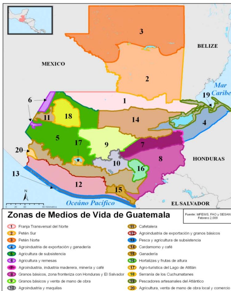
Fig. 2. Zonas de medios de Vida de Guatemala